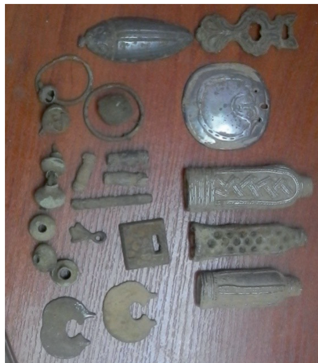
Иногда на месте городков встречаются предметы из металла.

пользовались изделия из глины, бронзы, кости. Из глины изготавливали лепные сосуды с закругленным дном. Иногда встречались чашевидные сосуды овальной формы орнаментированные только по-яском ямок или «жемчужин».