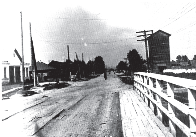
Пожарное депо и водонапорная башня.