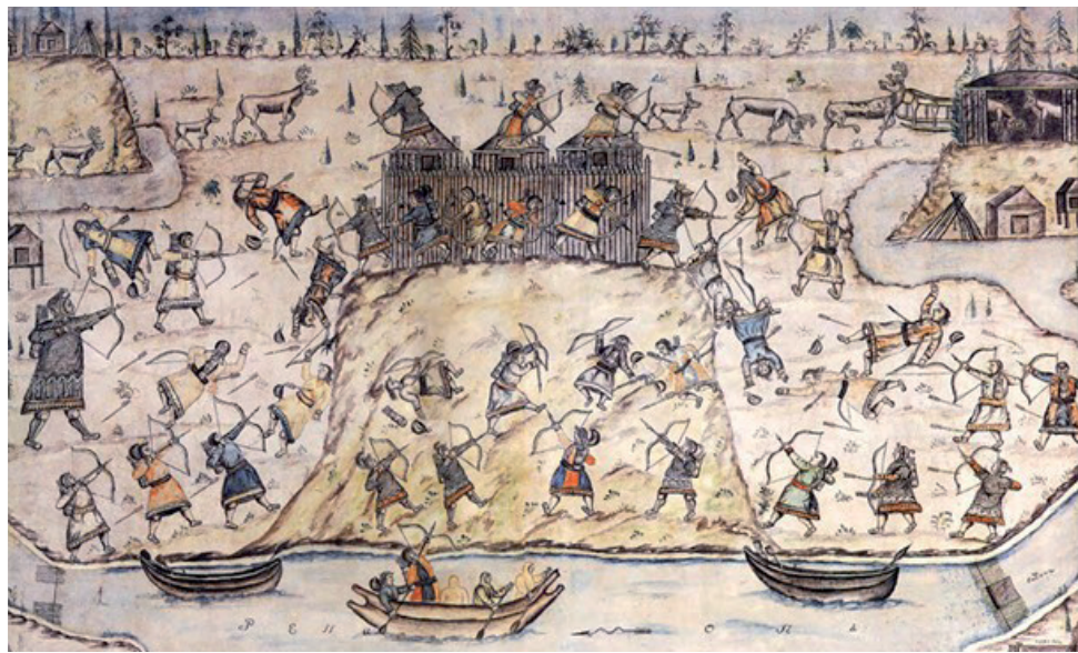
Штурм хантыйского городка.

Татарские улусы окружали Кашлык со всех сторон. Татары служили главной опорой ханской власти. Они оказали упорное сопротивление ермаковцам, и те сурово наказали их. Взяв с боя «крепкий татарский городок» на р. Аремзянке, казачий предводитель справился с «лучшими» татарскими «мергенями», чтобы навести страх на прочие улусы. Соседняя Надцынская волость была взята без сопротивления, зато в Туртасской волости казакам пришлось «учинить бой». Стычка была недолгой. За р. Туртасской располагалась Назымская волость. Здесь кончались татарские улусы и начинались хантыйские поселения. В заголовке «сказа» упоминалось о том, что Ермак послал казаков в демьянские и назымские городки. Однако в тексте о взятии Назыма и