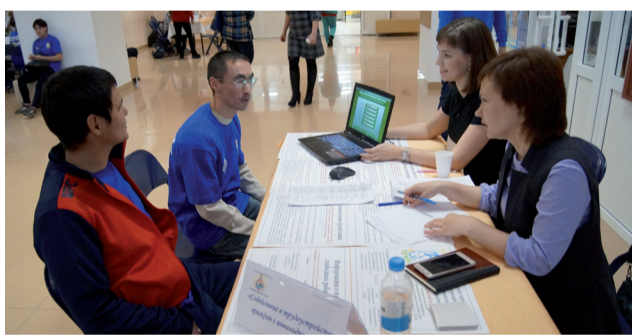
Центр занятости даёт консультации.