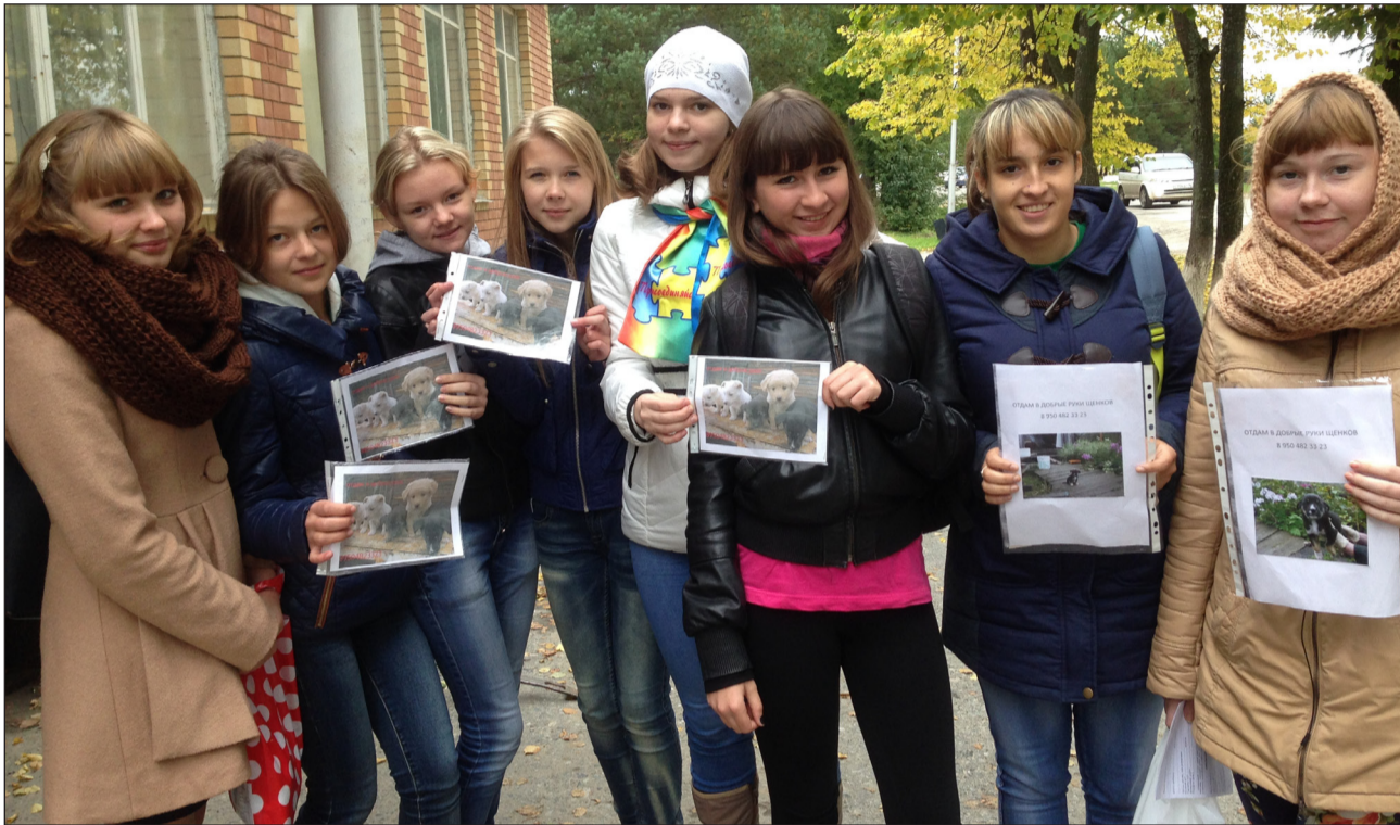
Волонтерский отряд «Лидер».