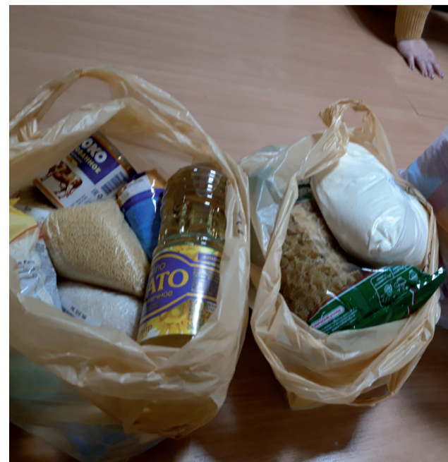
Содержимое «тележек добра» расфасовано по пакетам.

Попутно волонтеры узнают, кто в чем нуждается. Ведь помимо продуктов, кому-то из одиноких немощных стариков надо починить электропроводку или постирать, или прибраться в доме. Однако случается, что, приехав, получают отказ: «Спасибо, но нам ничего не надо, у нас всё есть». Подобные отказы только радуют. Чтобы у населения не возникало «неудобных» вопросов, завели журнал учета вынуженного из тележек, с указанием, сколько получилось пакетов, кто произвел выемку (под подпись) и по каким адресам были отправлены продукты. Однако данная акция не отменяет работы волонтеров по обеспечению лекарствами и продуктами пожилых людей, находящихся на самоизоляции, но за их счет. А тут за деньги посторонних людей, которые даже не узнают, кому конкретно переданы продукты, купленные ими.