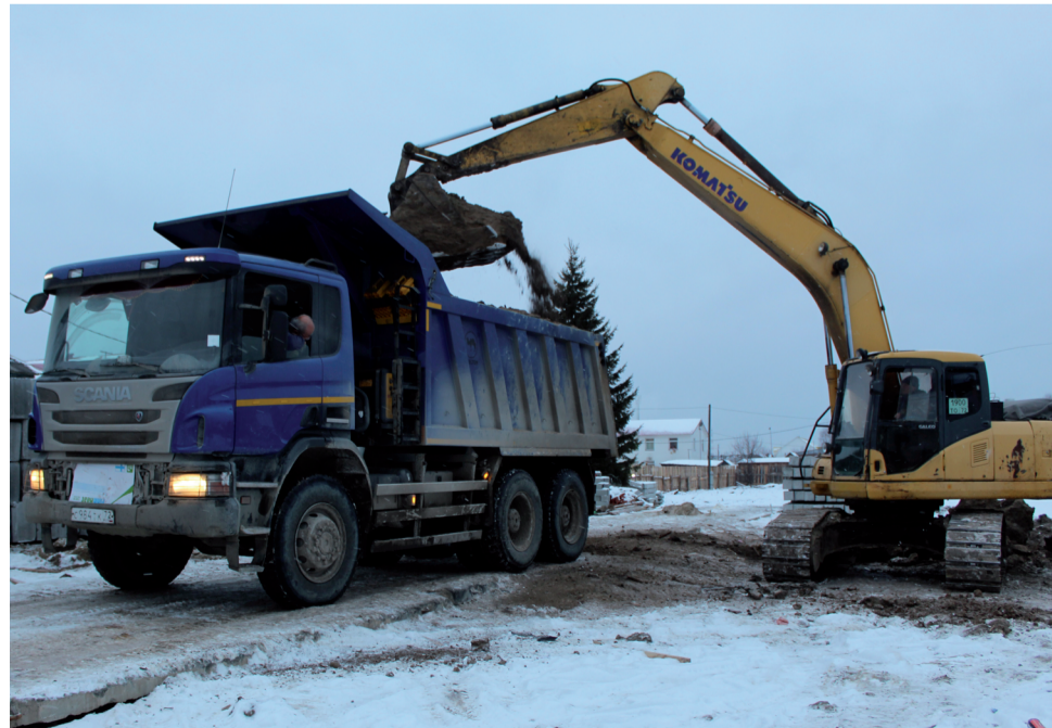
Идёт выемка грунта для устройства котлована.