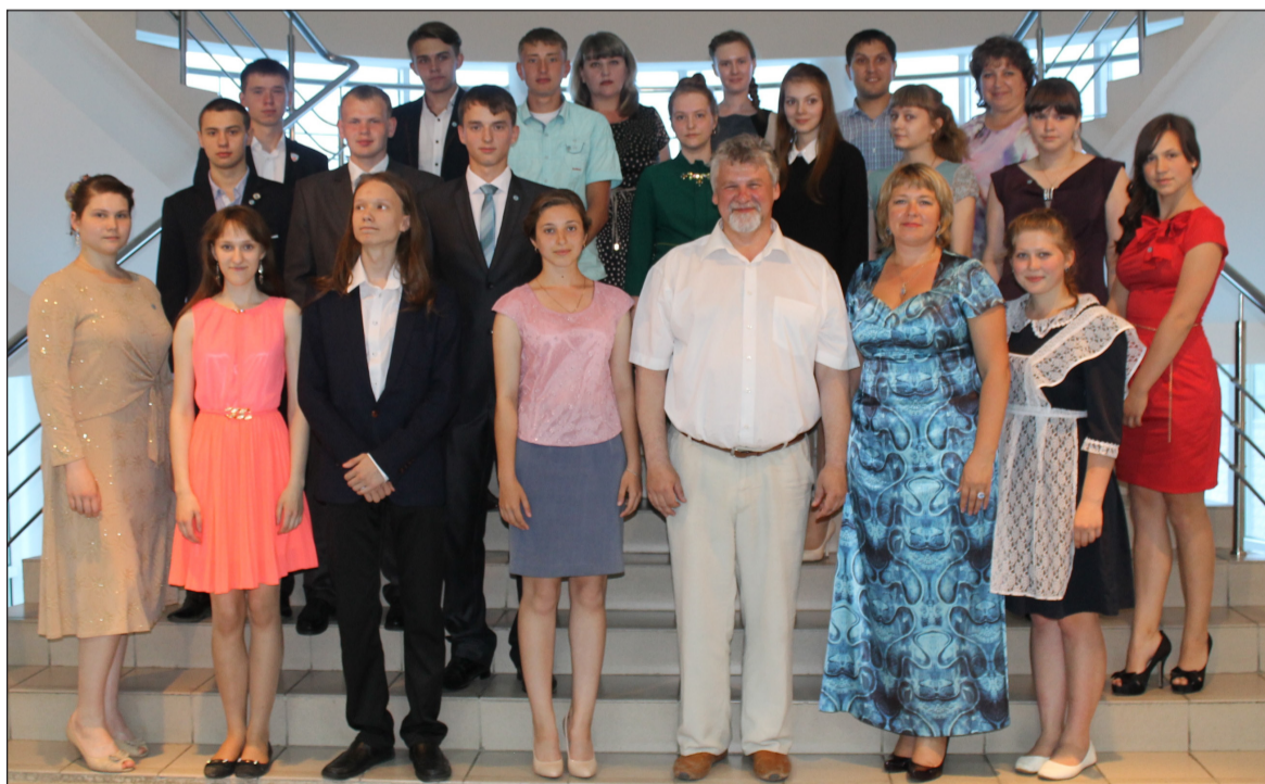
Общее фото на память.

Затем официальная часть плавно перешла в неформальное общение, разговор состоялся непринужденный, доброжелатель-