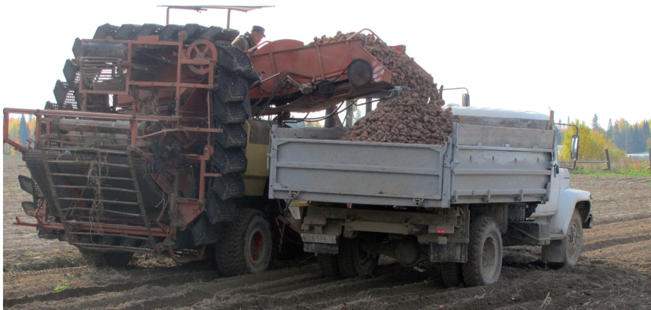
Идёт уборка картофеля с полей ООО «Лэнни».