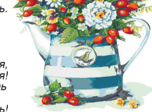
Совет ветеранов, с. Першино

Прекрасный праздник - юбилей, И поздравления скорей Хотим душевные доставить, Чтоб капельку тепла