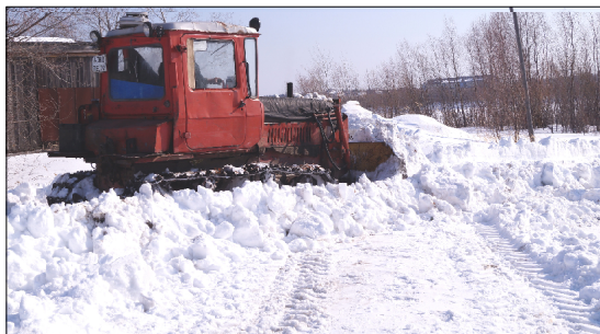
Борьба со снегом в самом разгаре.