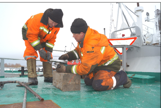
Рабочие паромной переправы проверяют инструменты.