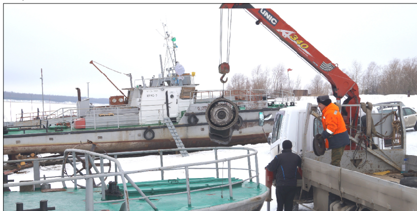
Перед установкой паромного редуктора.

Непростой навигационный сезон прошлого года и зимние месяцы изрядно потрепали и без того старенькую технику, перевозящую людей и автомобили через Иртыш в Увате. У рабочих паромной переправы Уватского ДРСУ впереди ещё как минимум месяц, для того чтобы встретить первых пассажиров в полной боевой готовности.