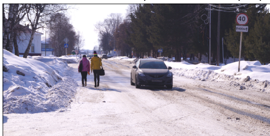
Тротуары в Увате крайне необходимы.