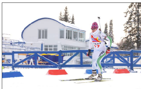
Спринтерская гонка прошла в сложных погодных условиях.

Отметим, что больше половины спортсменок, борющихся за окружное лидерство, являются делегатами Ханты-Мансийского автономного округа. Также на соревнованиях были представлены воспитанницы Челябинской, Свердловской и Тюменской