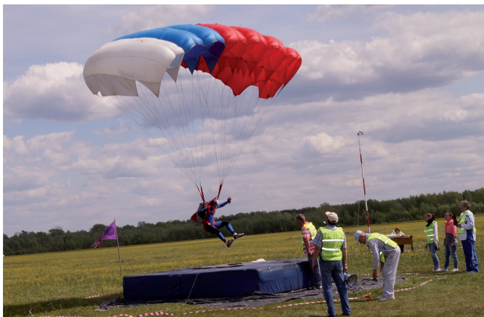
Участники соревнуются на точность приземления.