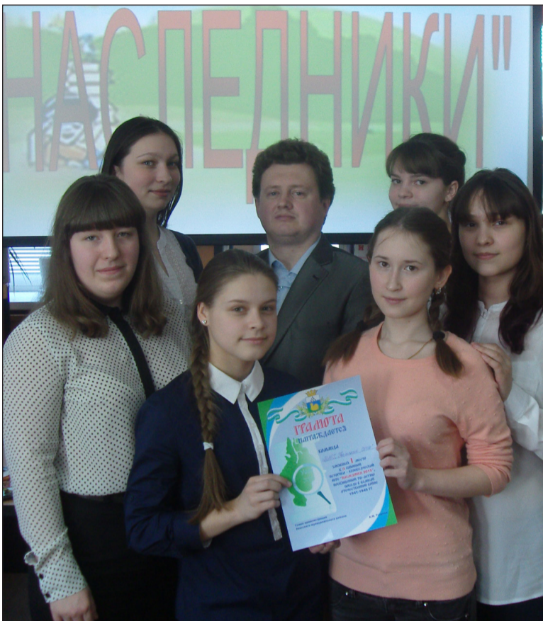
Команда Уватской средней школы.

Девятая районная детская историко-краеведческая игра «Наследники» прошла 18 марта на базе центральной районной библиотеки.