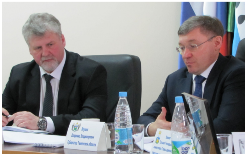
Глава администрации района А.М. Тулупов и губернатор Тюменской области В.В. Якушев обсуждают тему жилищного строительства.