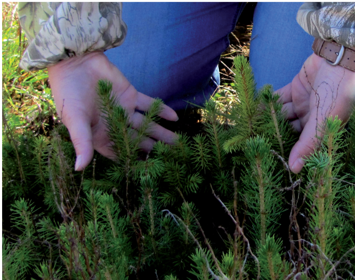
Лес будущего в надёжных руках.

Конечно, нам, лесникам, обидно, что нас присоединили к авиабазе, а слово «лес» вообще исчезло из обихода. У нас всегда