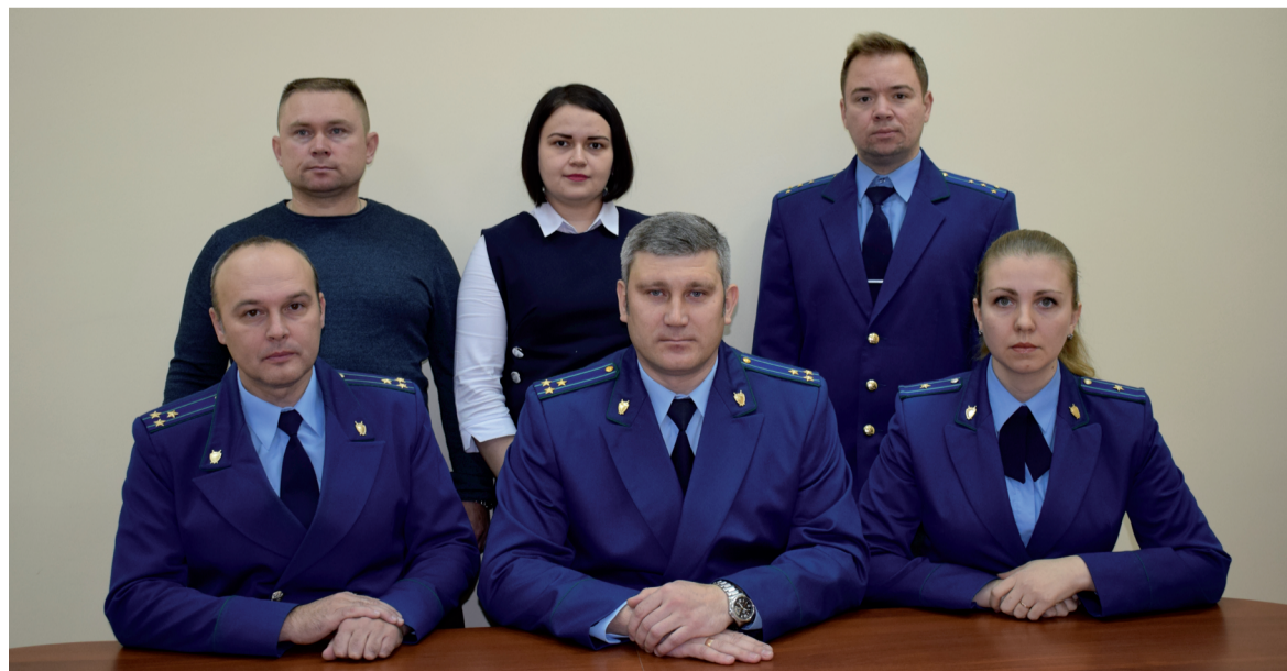
Коллектив прокуратуры Уватского района (2018 г.)