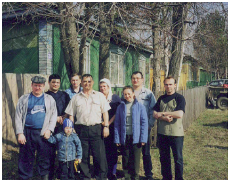
На субботнике (2003 г.)