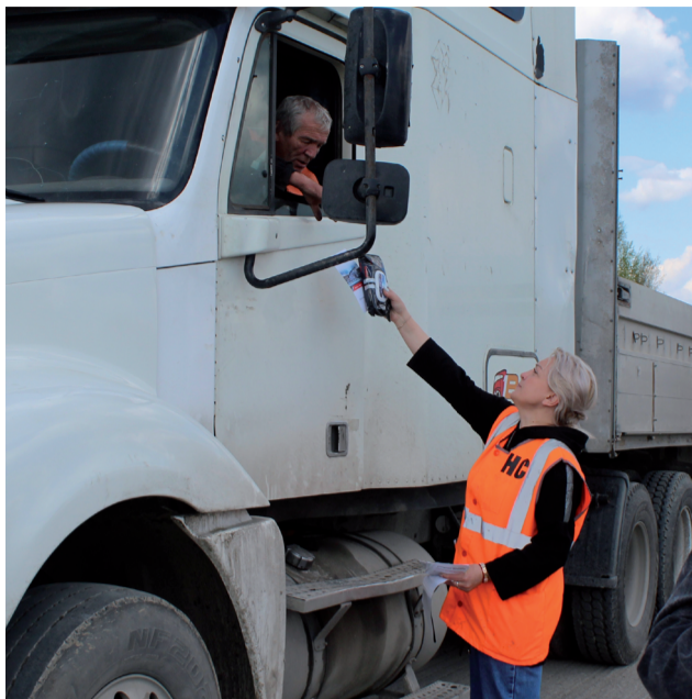
Памятку - водителю.