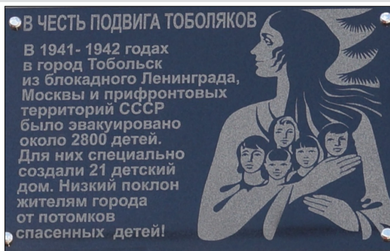
Доска Памяти в честь подвига тоболяков.