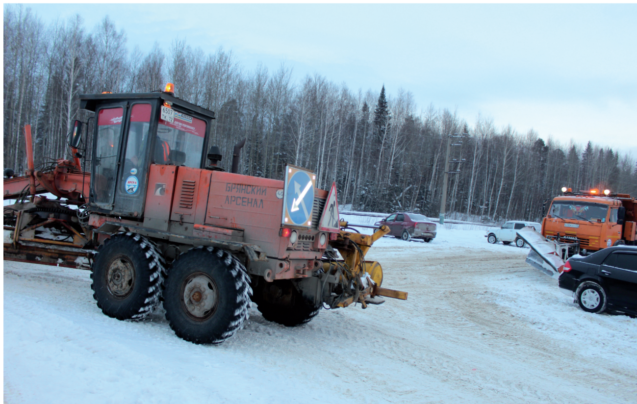
Начало рабочего дня. Техника выезжает на объекты.