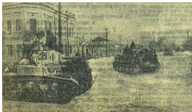
В освобожденном Белгороде.