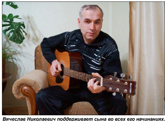
Вячеслав Николаевич поддерживает сына во всех его начинаниях.