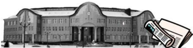
Администрация Уватского муниципального района

13 апреля в здании администрации Уватского района состоялось очередное аппаратное совещание. Ключевой темой совещания стало подведение итогов размещения заказов для муниципальных нужд Уватского района в 2014 году.