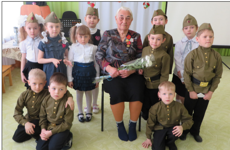
Настоящий праздник, посвященный Дню Победы, состоялся в АУ ДО «Детский сад Малышок Уватского муниципального района».

Концерт получился очень впечатляющим! Яркое оформление зала, звонкие голоса детей, костюмы, радостные улыбки зрителей и, конечно, аплодисменты создали праздничную атмосферу.