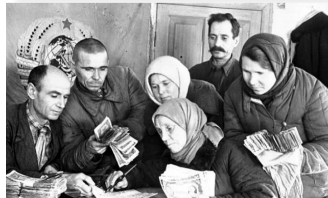
Подготовил Валентин ПОСПЕЛОВ