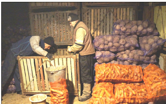
Идёт сортировка овощей.