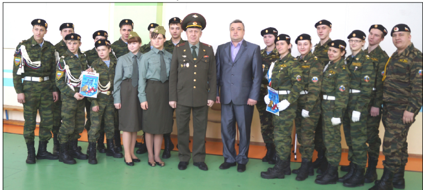
Участники и члены жюри военно-патриотической игры «Чтобы помнили».