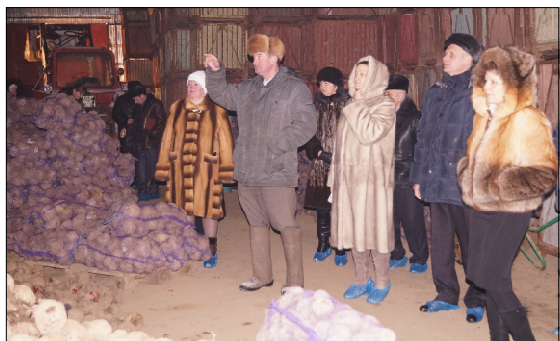
Во время экскурсии в овощехранилище.