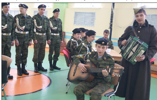
Визитная карточка команды «Казак».