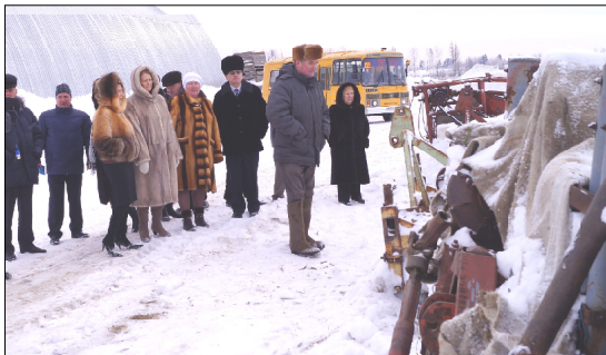
Сельхозтехника подготовлена к весне.