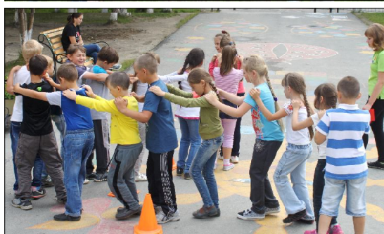
бю местных частушек.

И конец смены будет посвящен изучению нашей малой родины. Школьники узнают о разном составе нашего края и о традициях каждого из них.