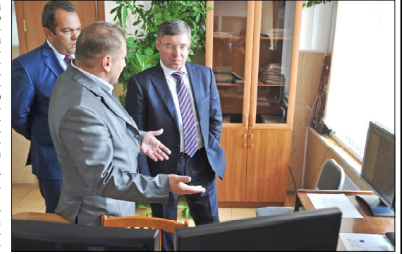
Владимир Якушев во время посещения ООО ЖХК «Викуловское».

Все крупные населенные пункты, включая районные центры, в Тюменской области должны перейти на подземные источники воды в течение двух лет. Об этом заявил временно исполняющий обязанности губернатора Тюменской области Владимир Якушев на встрече с жителями Викуловского района.