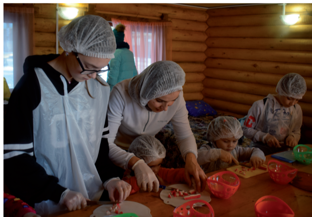
Мастер-класс для маленьких поварят.

Пока ребятня была занята, их родители приступили к основному конкурсу «Блюда семейной кухни». Молодые родители и их близкие готовили свои фирменные блюда на костре или мангале, в казане или в котелке. Возле каждого домика струился сизый дымок, и пахло ароматами готовившегося блюда. Перефразируя популярную песенку, можно сказать: «наши папы могут всё, что угодно: и дрова рубить, и за дичью ходить...». А мамы? Мама-