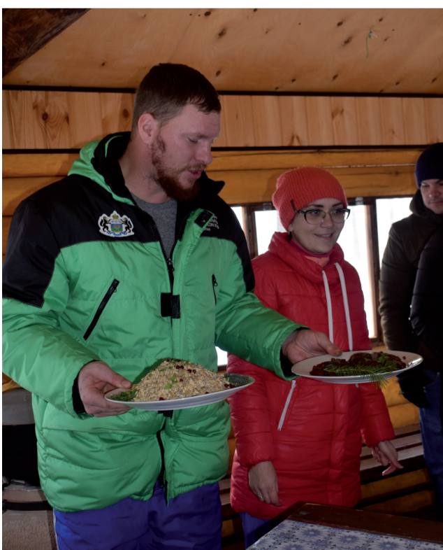
Деликатесы от семьи Гордиевских.