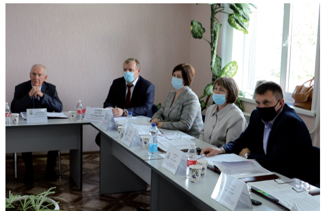
Выездное заседание Думы прошло в Ивановском сельском поселении.