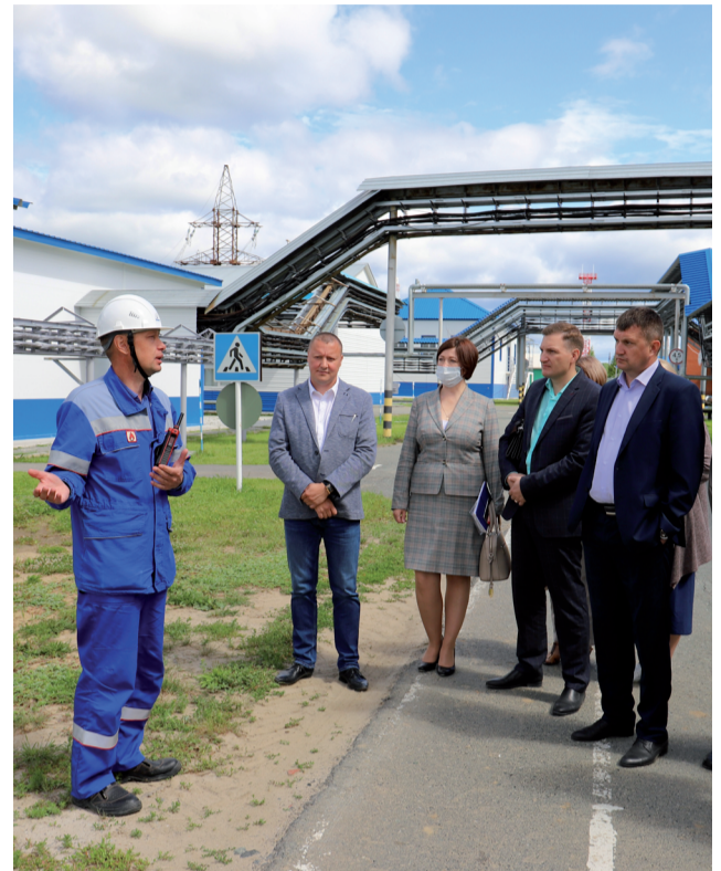
На производственной площадке ЛПДС «Уват».

Это значит, что мы выполнили все взятые на себя обязательства по защищенным статьям: содержание учреждений, выплата зарплат и пособий, обеспечение работы объектов жизнеобеспечения, благоустройство. А также исполнили бюджет развития в сбалансированной правительством области части.