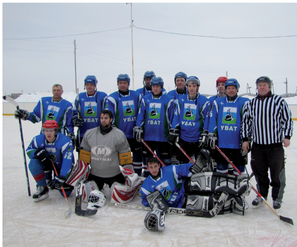
Хоккейная команда взрослых (2011 год).