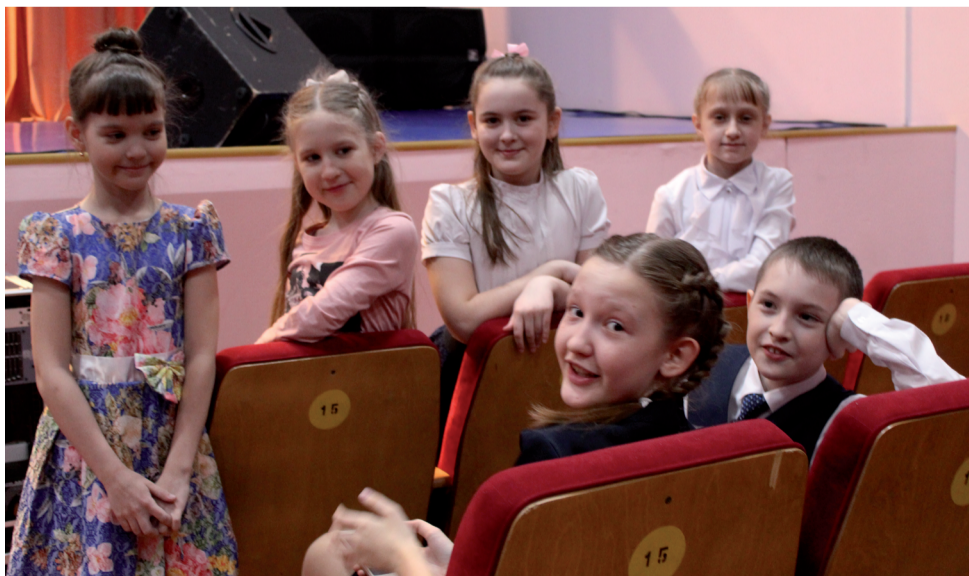
В ожидании решения жюри.