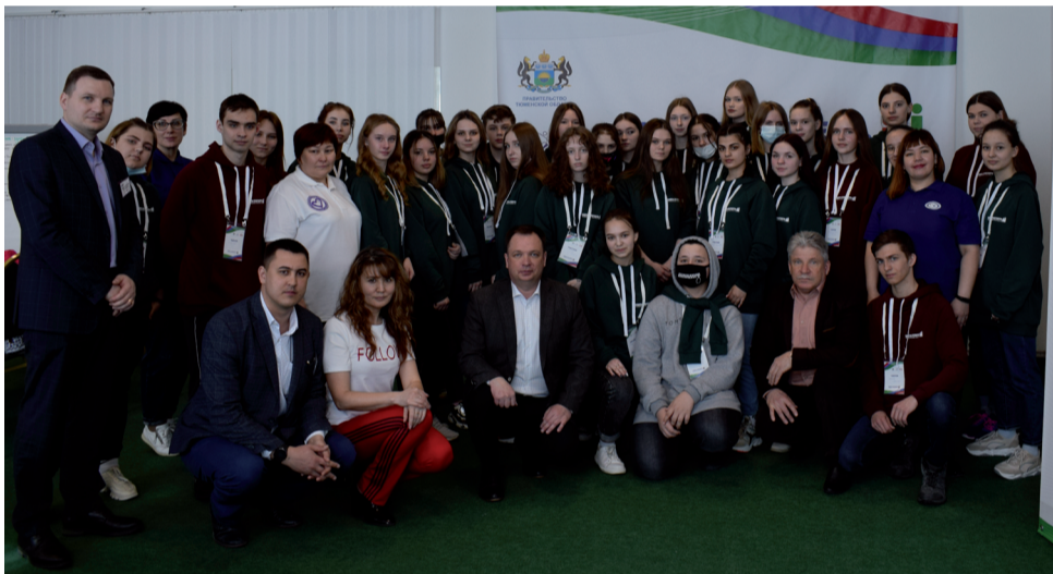
Участники проекта «Кадры будущего. Тюменская область».