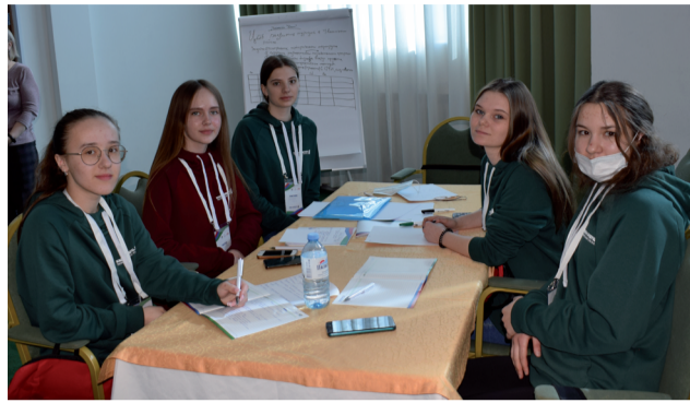
Ивановские школьники разрабатывают проект «Туризм».

«Кадры будущего» увлеченно включились в творческий процесс. Так, учащиеся школы поселка Демьянка разрабатывают проект в сфере ЖКХ, решая проблемы экологии. Проект Ивановской школы «Вакцина добра» на-