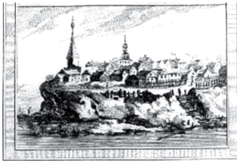
VUE DE DEMIANSKOY-YAM.

Уже вскоре после основания Демьянского яма стала очевидной