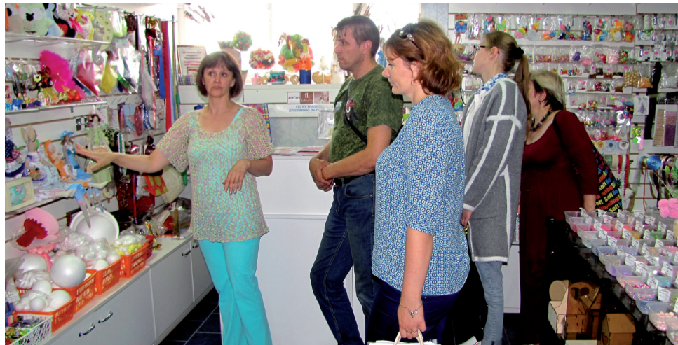
Участники Школы предпринимательства для обмена опытом совершили ознакомительные поездки по объектам бизнеса.

Владимир НАСЫРОВ