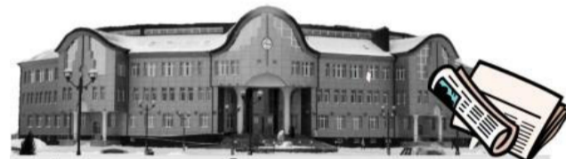
Администрация Уватского муниципального района

22 июня в здании администрации Уватского муниципального района состоялось очередное аппаратное совещание.