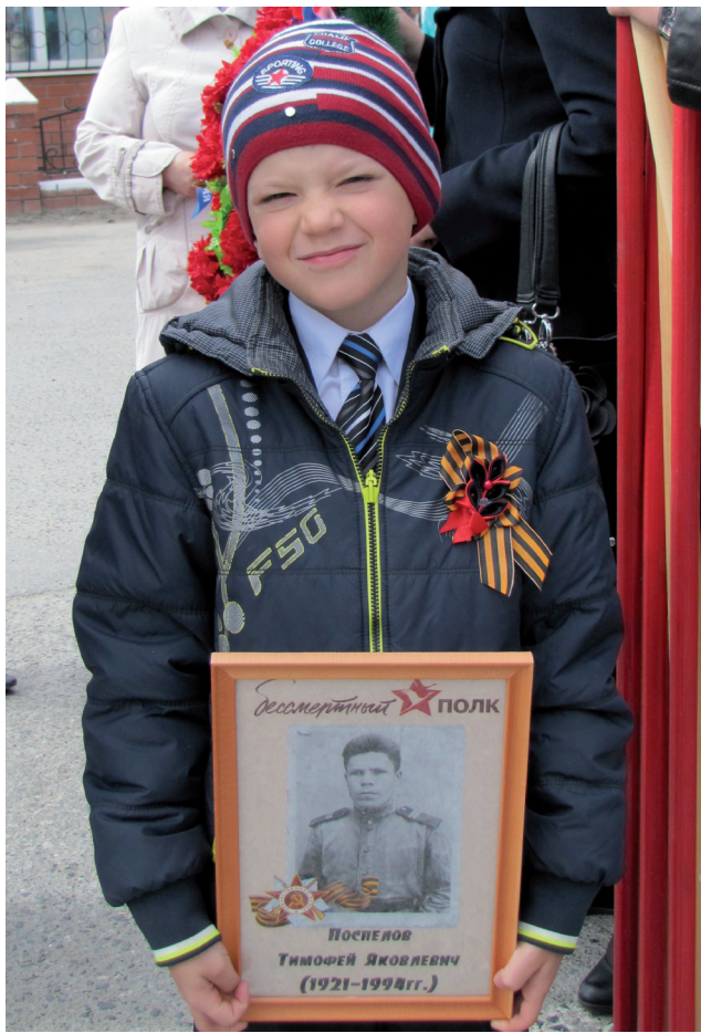
Я иду вместе с моим прадедом в «Бессмертный полк».