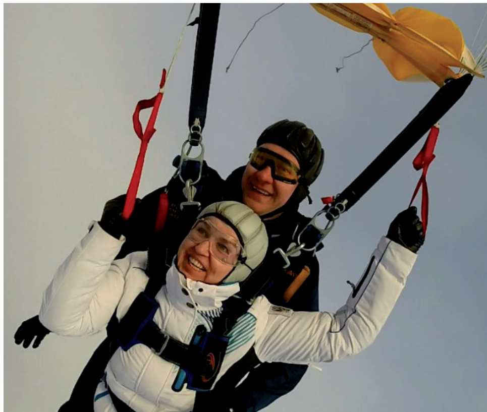
Очередной прыжок в тандеме.

Владимир НАСЫРОВ