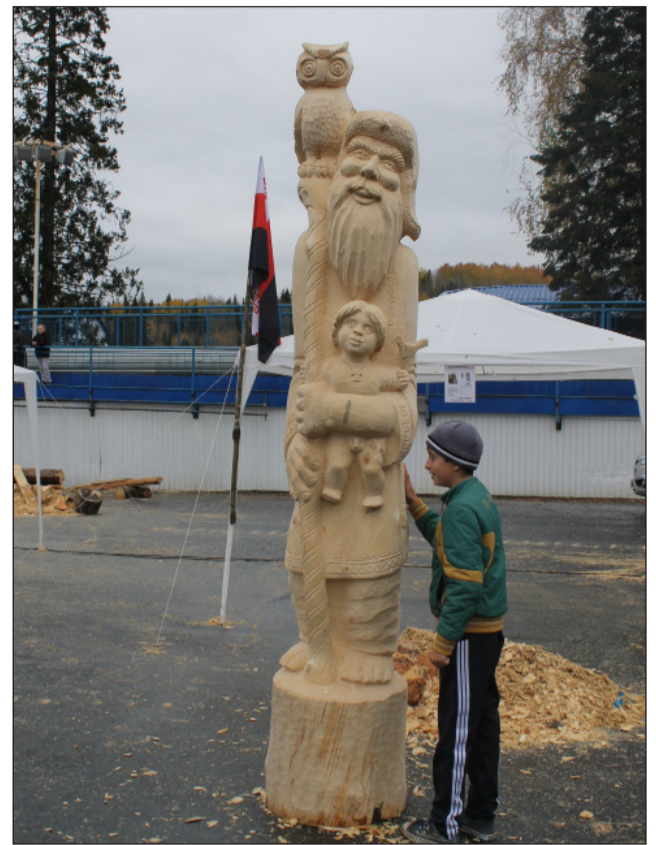
Прикосновение к «Сказочнику».