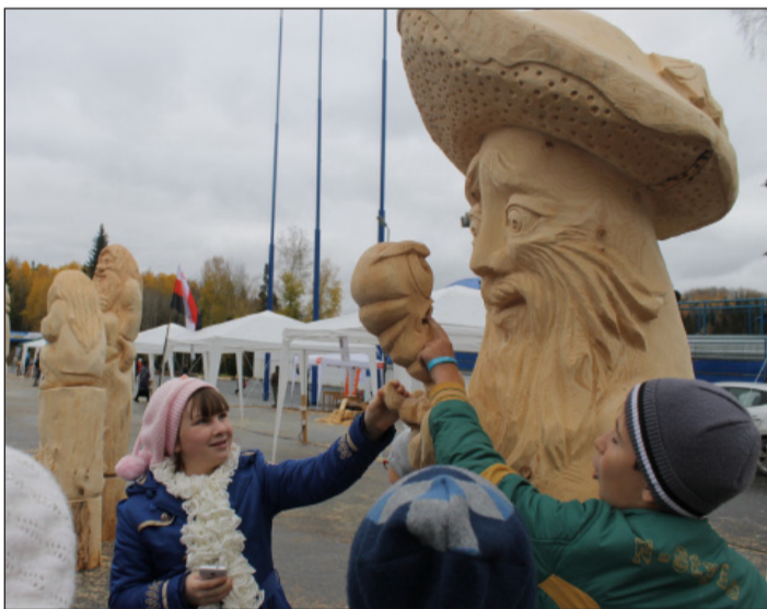
«Смирение», автор В. Коновалов.