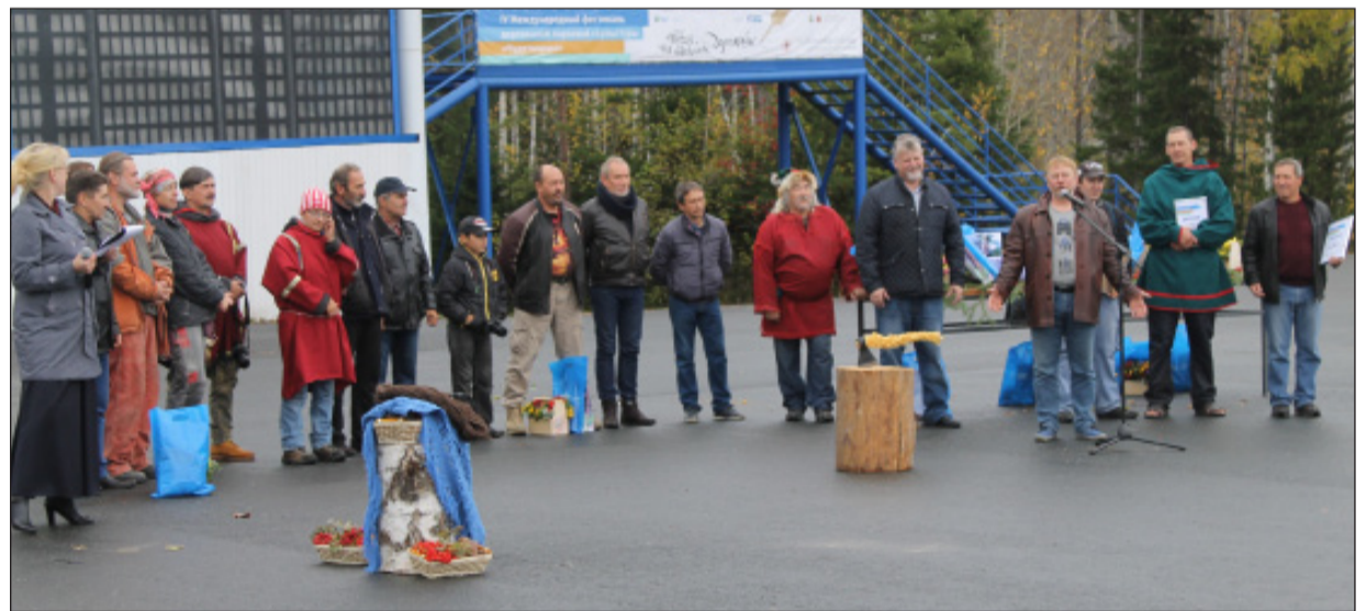
Награждение победителей и призёров фестиваля.