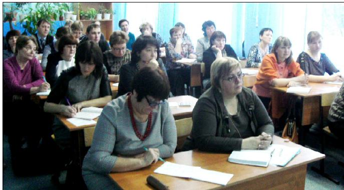
Участники единого муниципального методического дня.

Сегодня, в этот славный юбилей, Пусть тень годов не отразится болью, Желаем светлых в жизни дней, Большого счастья, крепкого здоровья! Совет ветеранов, пос. Туртас