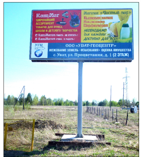
Рекламная конструкция, оформленная по всем правилам.

а) заявление о выдаче разрешения на установку рекламной конструкции; б) документы, содержащие данные о заявителе: - для юридического лица - копии, заверенные надлежащим образом: свидетельства о государственной регистрации юридического лица, выписки из Единого государственного реестра юридических лиц, приказа (решения) о назначении руководителя на должность; - для физического лица, зарегистрированного в качестве индивидуального предпринимателя - копии, заверенные надлежащим образом: паспорта, свидетельства о государственной регистрации физического лица в качестве индивидуального предпринимателя, выписки из ЕГРИП; - для физического лица - копии паспорта, свидетельства о постановке на налоговый учет; - в заверенной надлежащим образом копия договора на установку и эксплуатацию рекламной конструкции, заключенного с собственником, иным законным владельцем имущества на присоединение к этому имуществу рекламной конструкции, если заявитель не является собственником или иным законным владельцем имущества (в многоквартирном доме - заверенная надлежащим образом копия протокола общего собрания собственников помещений в многоквартирном доме, договора на установку и эксплуатацию рекламной конструкции); г) копия документа, подтверждающего право собственности (владения) на имущество, удостоверяющая документом (владельцем); д) проект рекламной конструкции, выполненный в со-