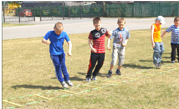
Ребята с удовольствием занимаются в футбольной секции ДЮСШ.