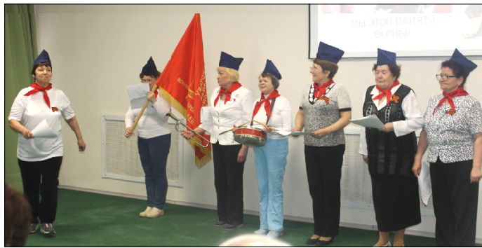
Выступление учителей-ветеранов Уватской школы.