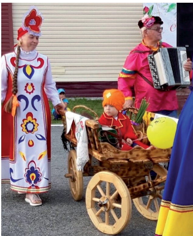
Коляска в русском стиле.