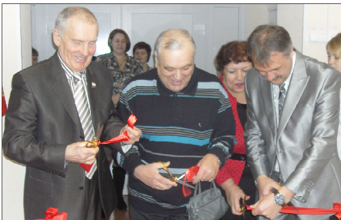
Торжественный момент открытия экспозиции.