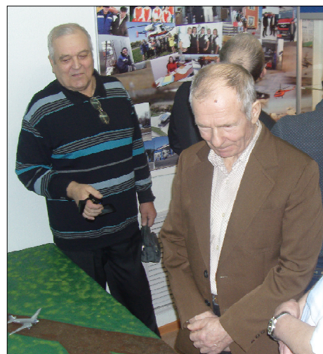
Экспонаты вызвали интерес даже у ветеранов авиации.