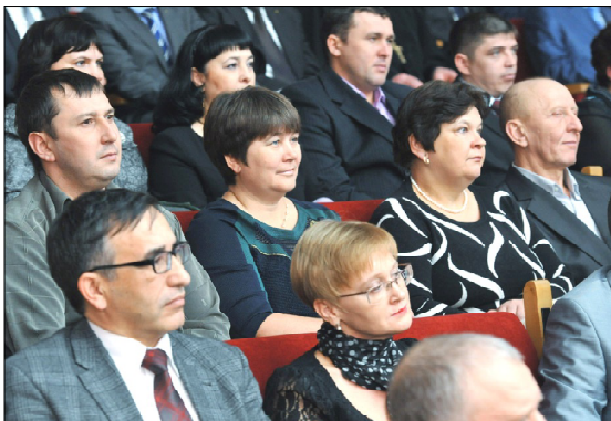
• 90-летие Уватского района