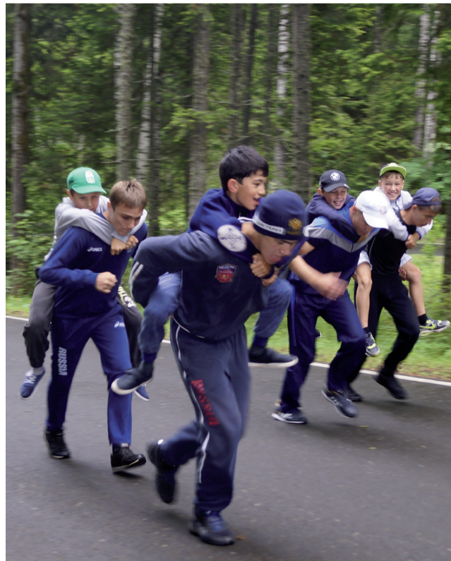
Подъём с утяжелением в гору - эффективный приём повышения выносливости и силы.

На Уватском биатлонном центре в разгаре межсезонная подготовка воспитанников Детско-юношеской спортивной школы. Недавно здесь повышали общефизические данные лыжники и биатлонисты, а сегодня совершенствуют навыки боксёры и греко-римские борцы.