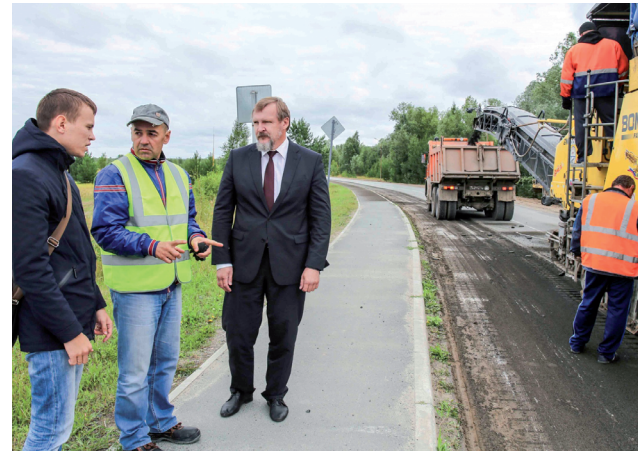
Пресс-служба администрации Уватского муниципального района