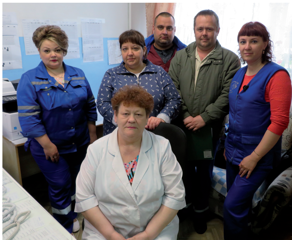
Работники отделения скорой медицинской помощи.