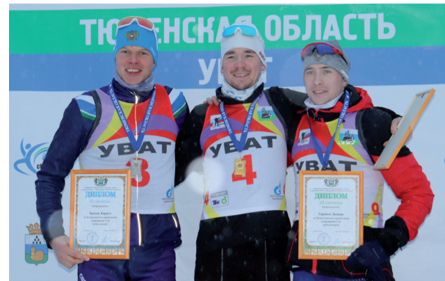
Победители суперспринта среди юниоров.

лонист из Тюменской области, принес золото. Причем его отрыв от ближайшего преследователя составил почти 13 секунд, а стрельба прошла чисто.