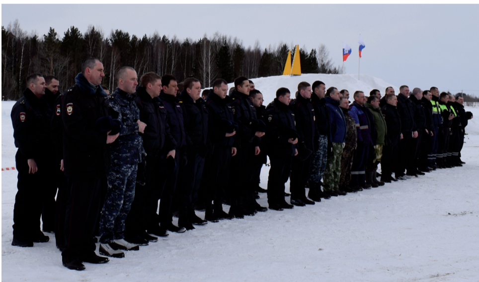
Личный состав почтил память сотрудников органов внутренних дел, погибших при исполнении служебных обязанностей, минутой молчания.