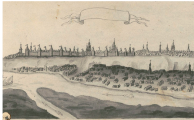
Вид Тобольска из Хорографической чертёжной книги.

Среди них наиболее интересны многокрасочные изображения к тексту о победе над Кучумом, овалы медальоны князей и царей, генеалогическое древо тобольских воевод и т. д.