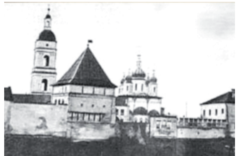
Тобольский кремль - единственный каменный кремль в Сибири.