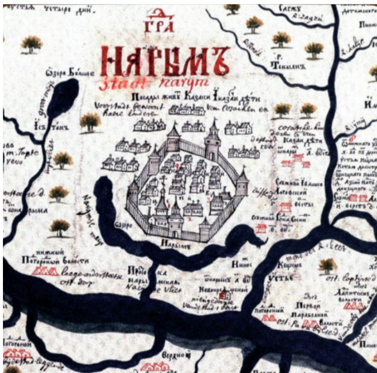
Фрагмент «Чертёжа Наринского города» из «Чертёжной книги Сибири».

Как художник Ремезов участвовал в украшении выносной часовни