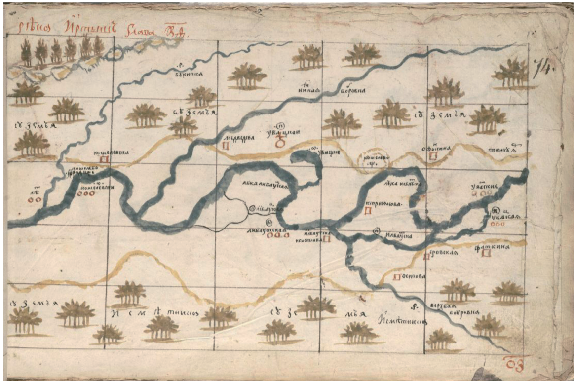
Деревня Увацкая на страницах Хорографической книги Сибири.

На верхней крышке переплета издания рельефным тиснением воспроизведена орнаментальная