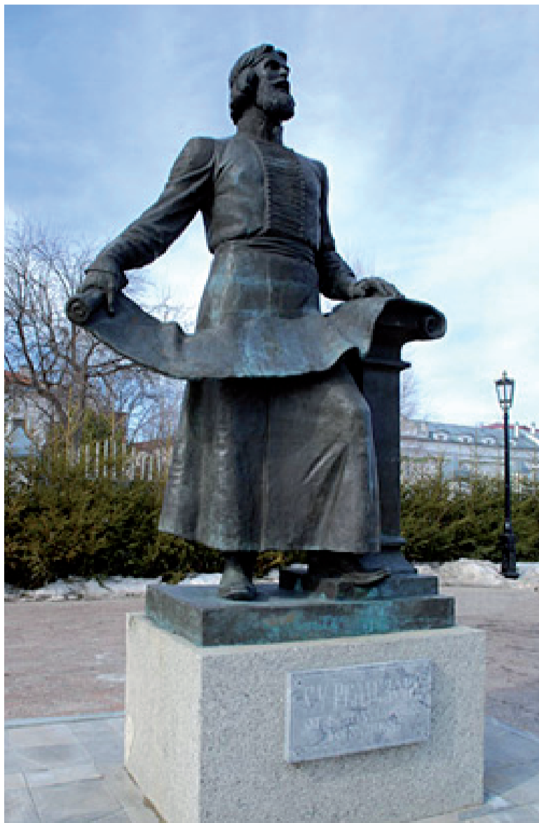
Памятник Семёну Ремезову в городе Тобольске.

Подготовлено по материалам Тюменской областной научной библиотеки им. Д.И. Менделеева