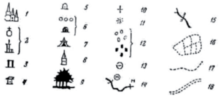
Условные знаки в атласах Ремезова: 1 - город, 2 - слобода, село, 3 - деревня, 4 - русская деревня, 5 - «татарская» деревня, 6 - юрты, 7 - кочи, 8 - мечеть, 9 - лес (бор), 10 - кладбище, 11 - мольбище, 12 - курганы, 13 - караул, 14 - мельница, 15 - перебор (запор) для ловли рыбы, 16 - пашни, 17 - дороги, 18 - большая дорога.