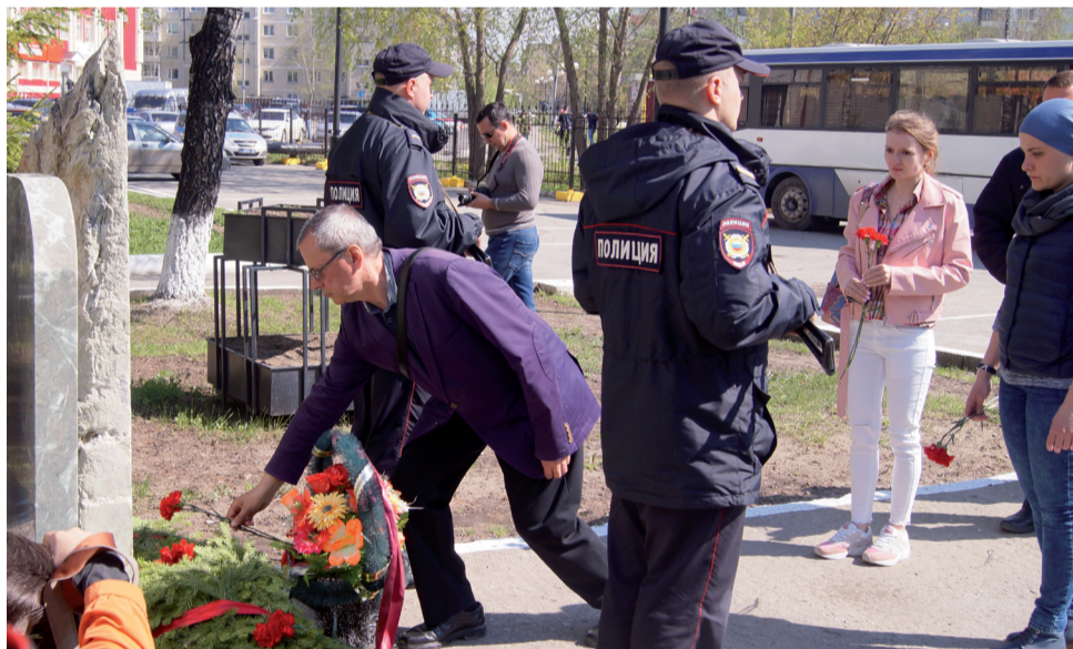
Возложение цветов к памятнику полицейских, погибших при исполнении служебного долга.

Сегодня Тюрменный замок Тобольска - это музей, посетить который стоит хотя бы ради истории. Древняя столица Сибири - это не