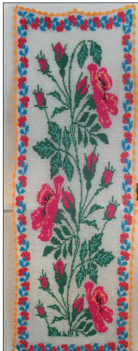
Раиса Ковкова канву для вышивания вяжет крючком.

Особенные «кругляши» получают у Галины Захаровой: яркие, с замысловатым рисунком, но при этом очень практичные. Глядя на них, искренне удивляешься умению мастерицы использовать бросовый мате-