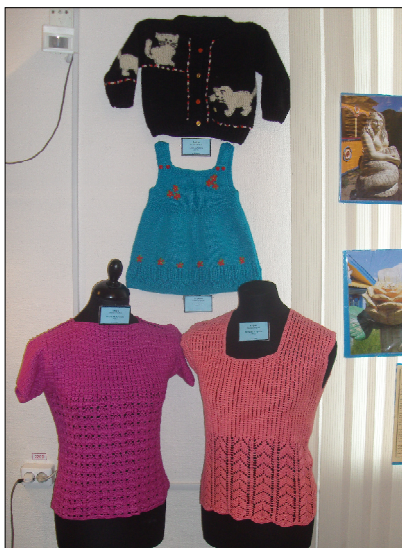
Красивые и практичные вязанные изделия от Валентины Стерховой.