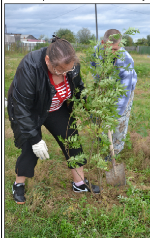
В селе Осинник высадили молодые рябинки.

29-30 августа в рамках акции «Зелёная Россия» в Уватском районе был проведён экологический субботник.