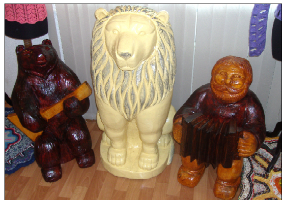
Ландшафтные деревянные скульптуры Евгения Чагрового.