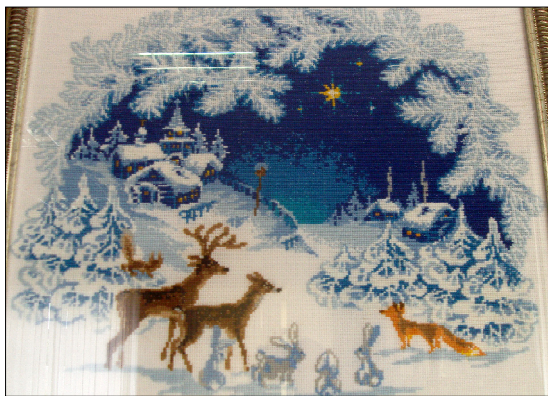
«Зимняя сказка» Марии Токаревских.