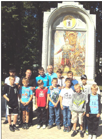
В музее «Слово о полку Игореве».