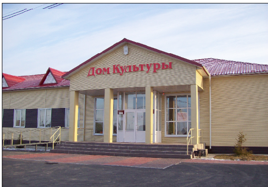
Дом культуры в пос. Першино.