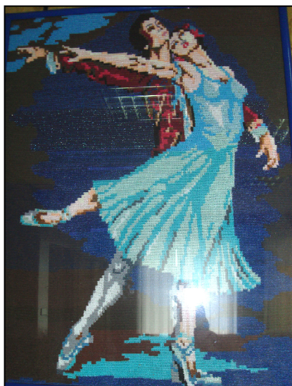
Вязание крючком в темпе «Адажи». Автор Лариса Медведева.