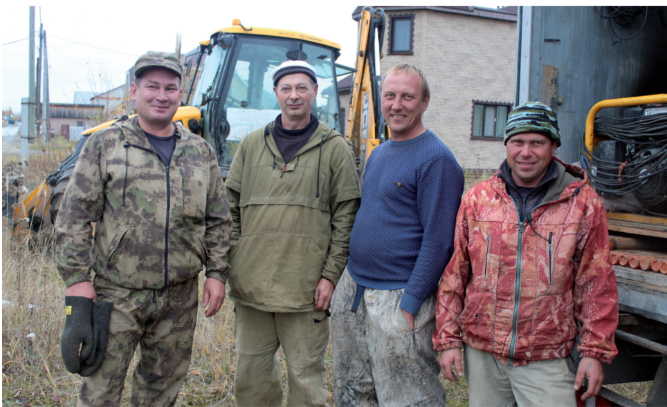
Бригада ООО «Дана-Строй».