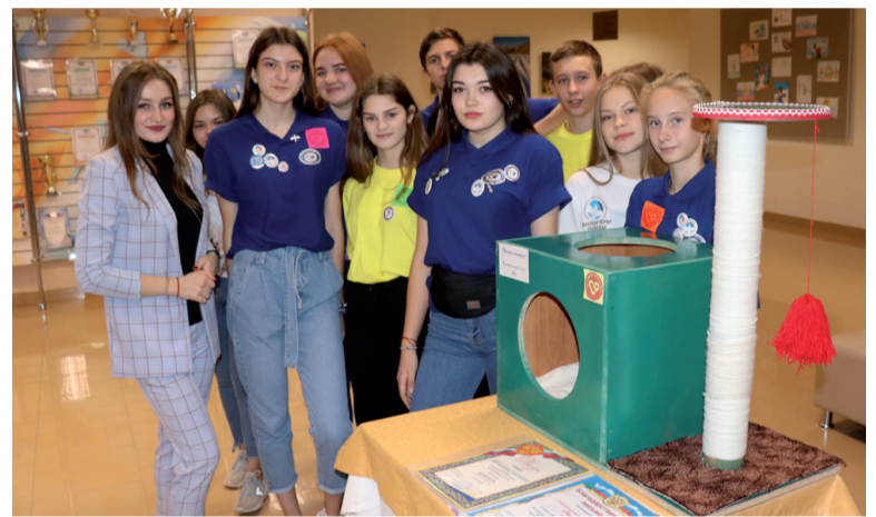
Волонтерский отряд «Лидер» с. Уват.