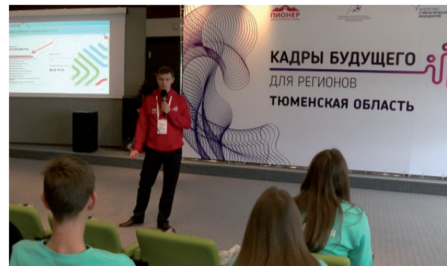
Во время учёбы в Губернаторской школе.