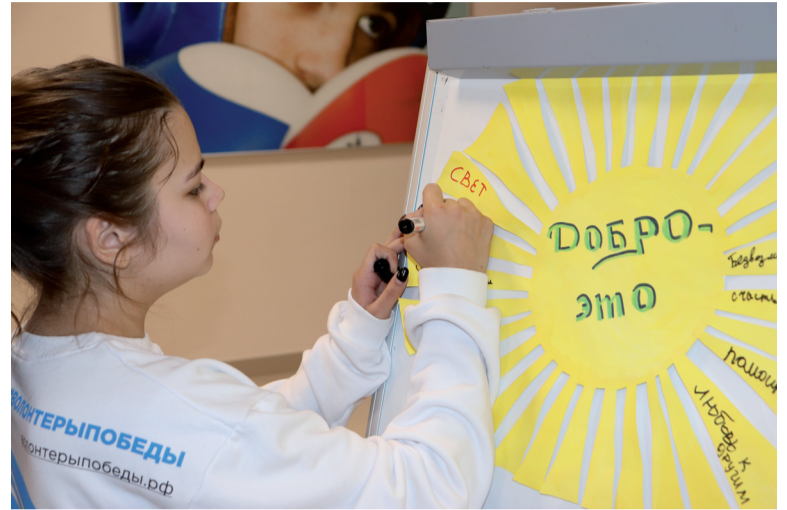
У слова «Добро» нашлось много ассоциаций.