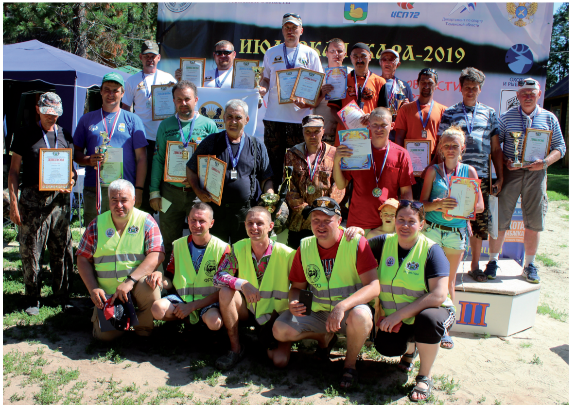
Победители, призёры и судьи чемпионата.