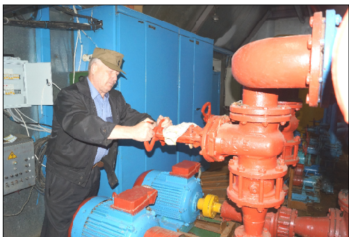
Регулировка подачи воды в старом здании водоочистных сооружений.