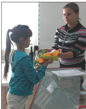
Подарки - первым посетителям.

Людей на открытии магазина было очень много, и все были в восторге: одно радовало удобство совершения по-