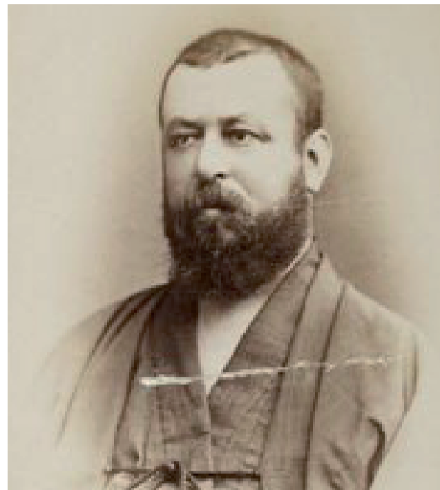
Путешественник и журналист Эдмон Котто.

Миновал полдень: завтрак обратился в обед... Первое блюдо выглядело как большие комья рубленого мяса; они, не знаю отчего, именуются здесь котлетами, хотя не имеют ни вкуса, ни формы. На второе подали суп: душистый бульон, в котором плавали кусочки фаршированного теста; затем после-