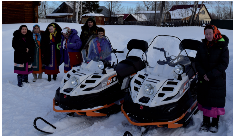
Хорошая помощь от «РН-Уватнефтегаза» для демьянских ханты.