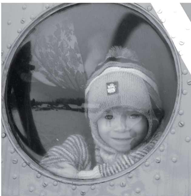
Каникулы закончились. Пора в школу.