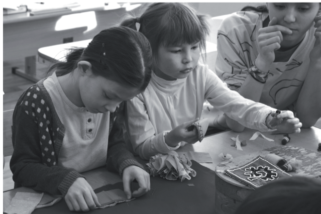
Дети изготавливают национальную куклу «Акань».