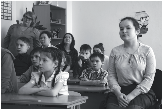
На уроке родного языка.