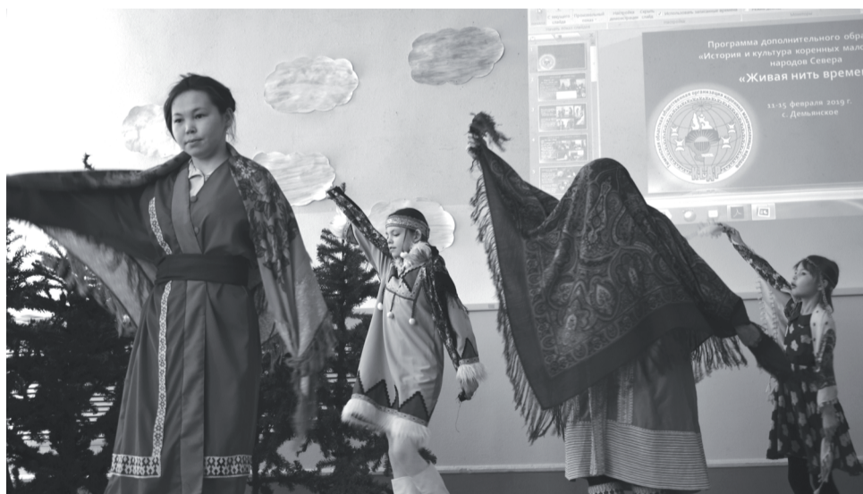
Исполнение хантыйского танца «Куренька».

Также Уватнефтегаз является организатором ярмарки продукции традиционных промыслов представителей КМНС.