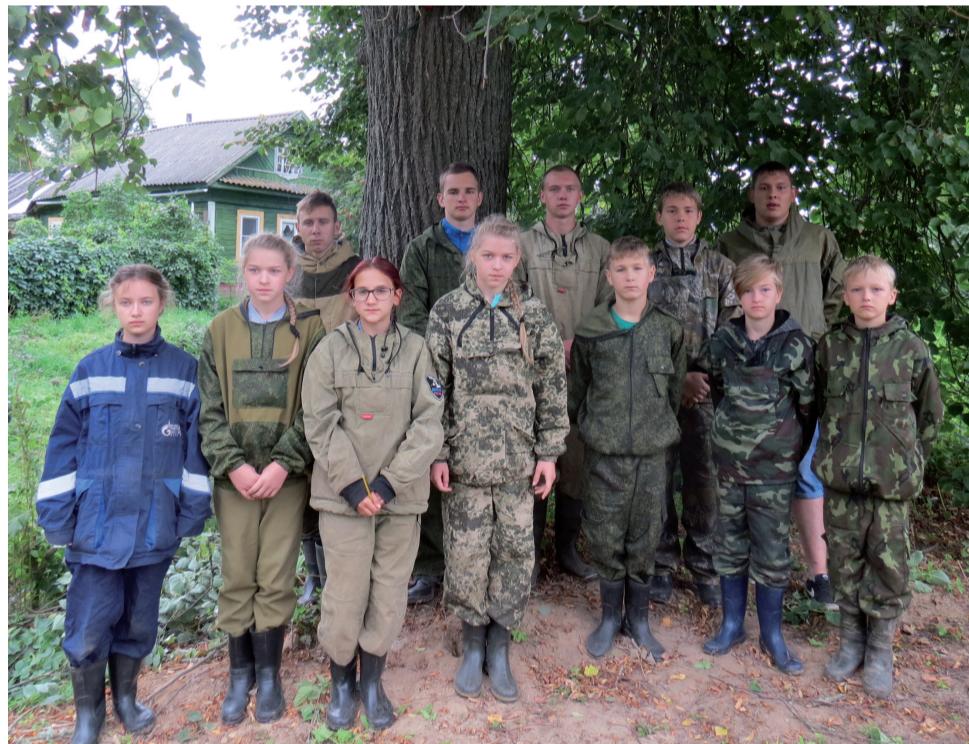
Бойцы летней экспедиции 2019 года.