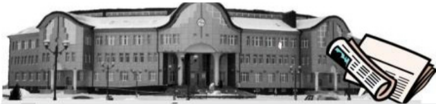
Администрация Уватского муниципального района

20 апреля в здании администрации Уватского муниципального района состоялось очередное аппаратное совещание.