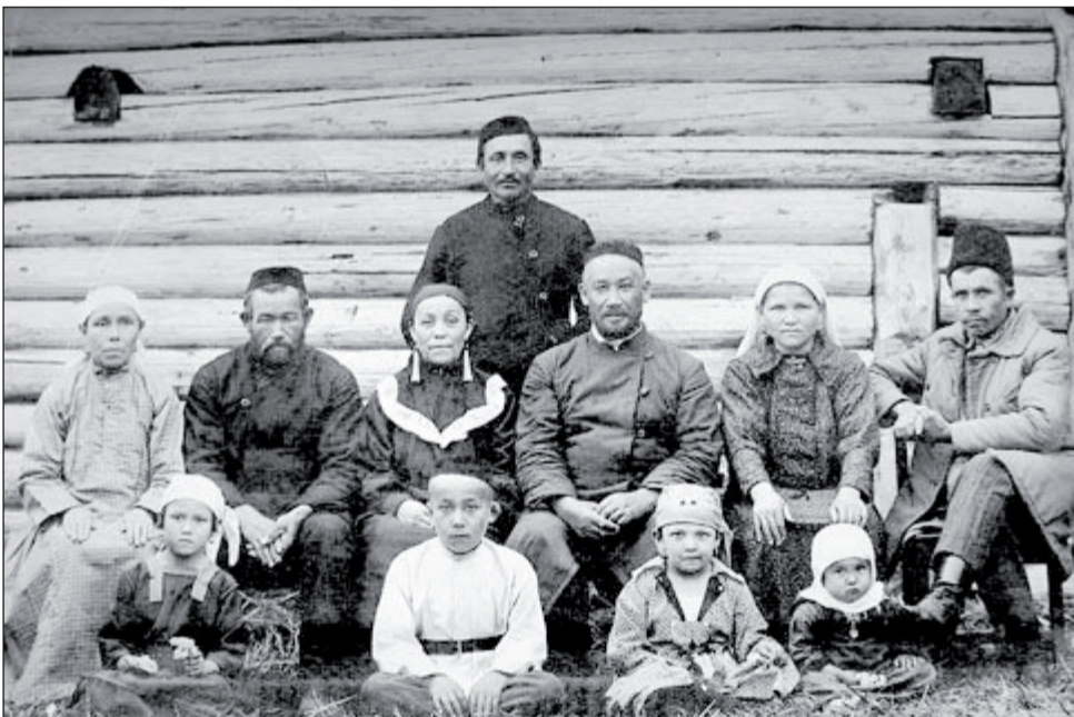
Семья сибирских татар (начало XX века).