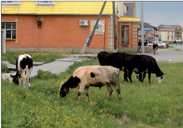
Так было ещё недавно.