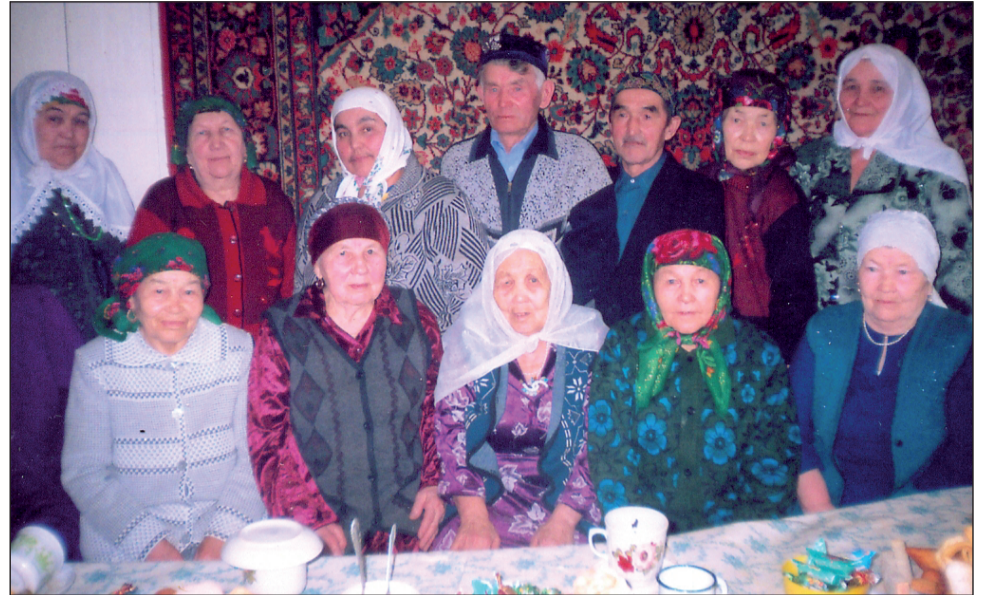
Жители д. Уки на празднике (конец XX века).

Речь сибирских татар отличается от литературного языка своим диалектизмом, например, оглушение звонких согласных: слово «каз» (гусь) - «кас», «бала» (ребенок) - «пала» и т.д. Также к