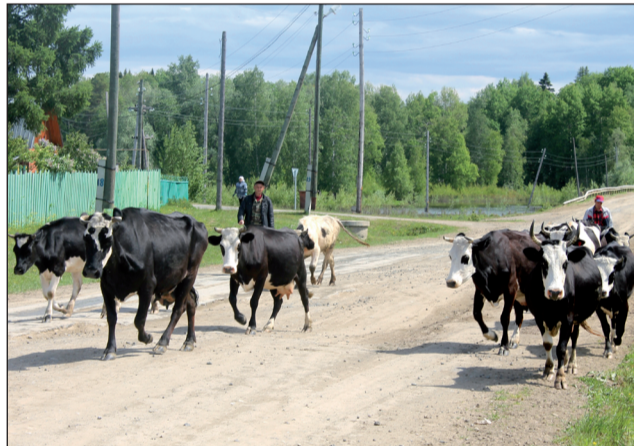
Этим летом организовано на пастбище.