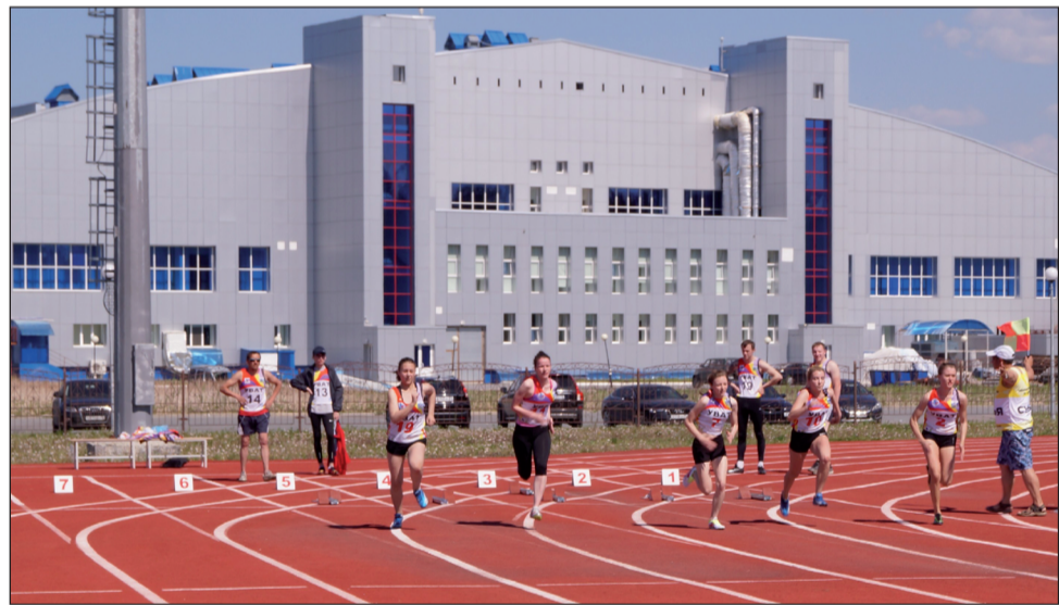
Сельские бегуны на дорожках стадиона «Атлант Уват».

В общекомандном зачете первое место завоевали спортсмены Туртасского сельского поселения. Вторыми стали команды Уватского сельского поселения, а третьими - Демьянского сельского поселения.