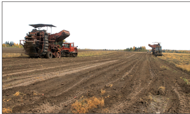
Кипит работа на полях ООО «Ленни».