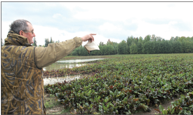
Так выглядели поля в конце августа.