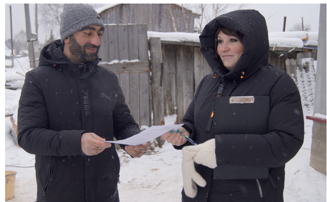
Вручается акт приёмки отремонтированного жилья.